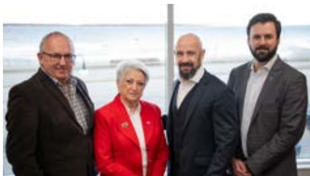
Les membres de l'exécutif de la TREM